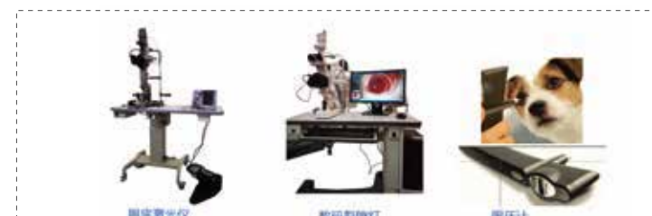
眼底照相仪器设备 (彩色眼底拍照)

美迪西完善的眼部检测系统还包括配置数码相机系统的裂隙灯，眼压计，眼底激光仪，间接检眼镜，眼科手术显微镜等。